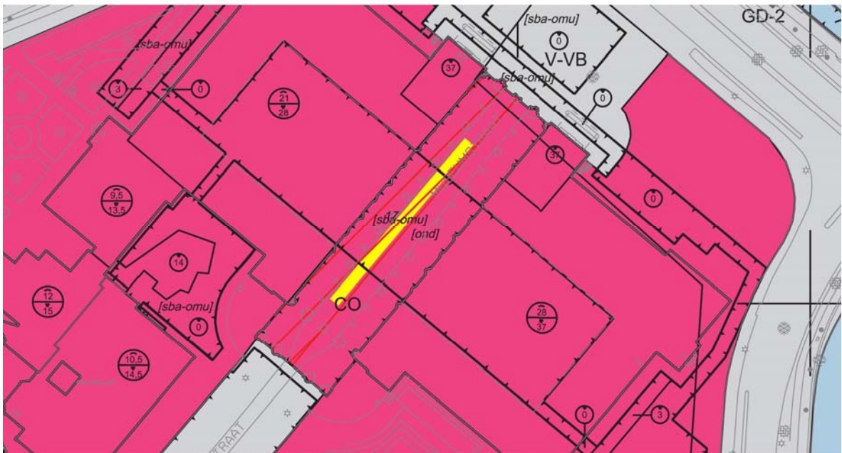
Afbeelding 1: het ruimtebeslag van de in 2009 door het Rijksmuseum voorgestelde alternatieve entree (excl. de ruimte bestemd voor het beoogde hekwerk)